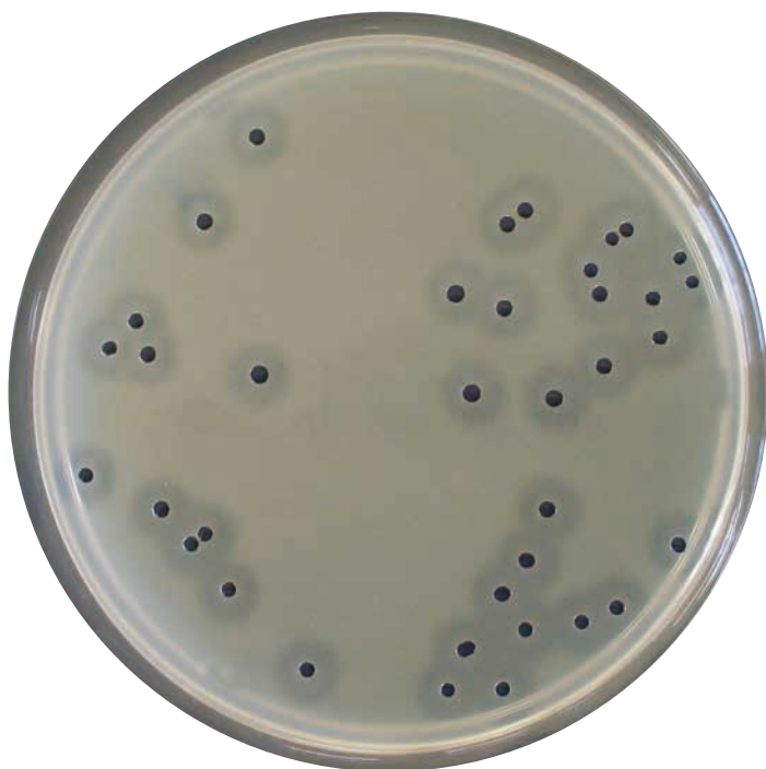
S. aureus 純培養例 (弊社保存株／48時間培養)

黄色ブドウ球菌の特徴である集落周囲の透明帯および集落直の白濁帯(いずれも卵黄反応)が明瞭です